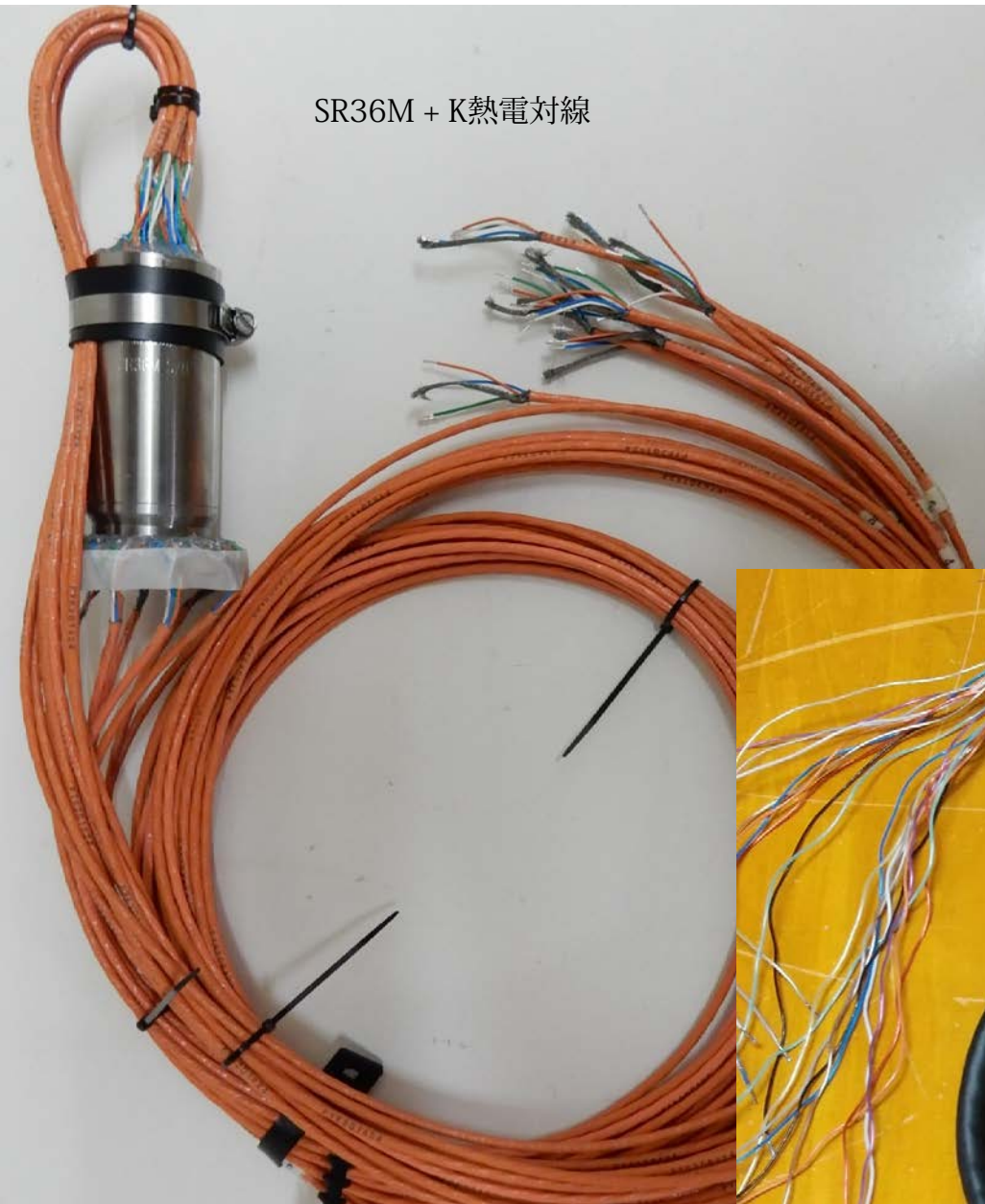
SR36M + K熱電対線