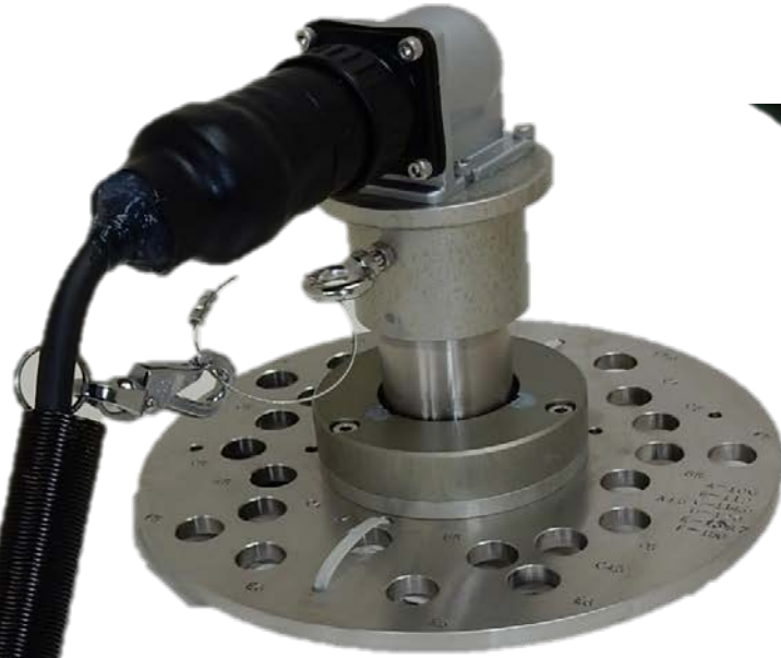
SR20M 組込み 流速計測用ホイール治具