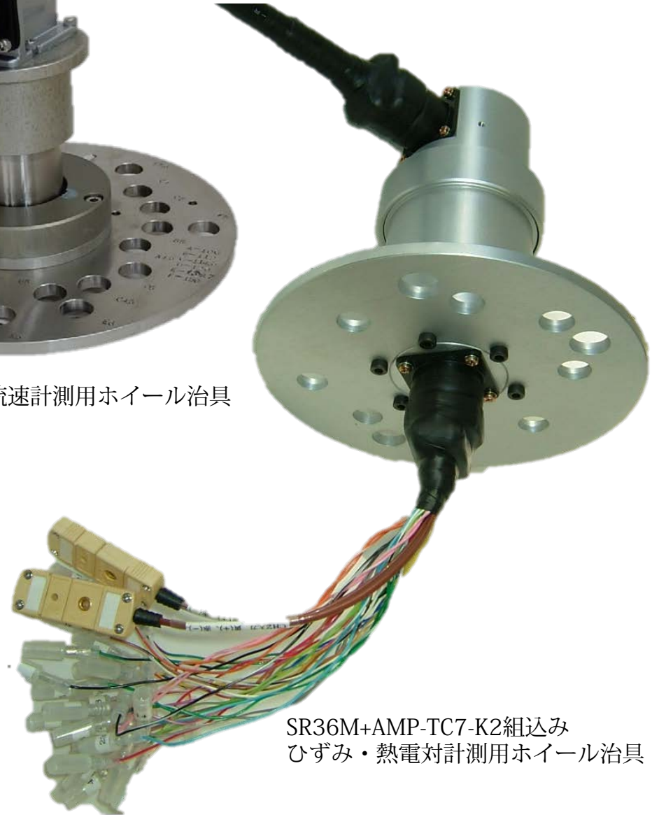
SR36M+AMP-TC7-K2組込み ひずみ・熱電対計測用ホイール治具