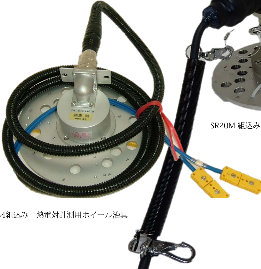
S4組込み 熱電対計測用ホイール治具