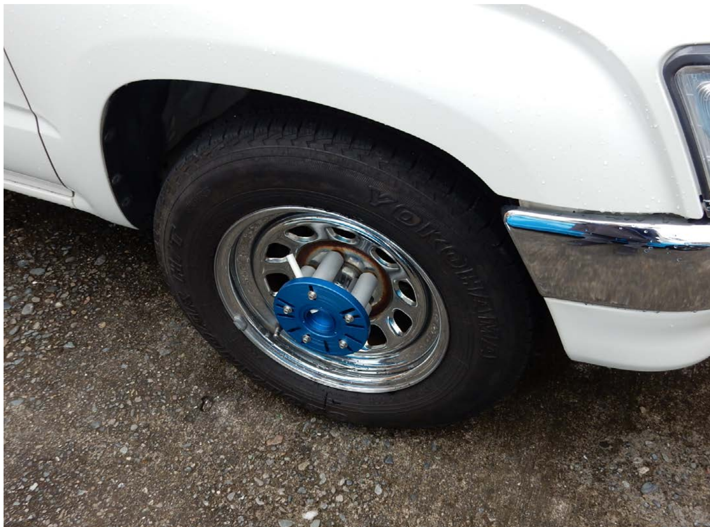
写真1. 取付例（円板は付属しません。）