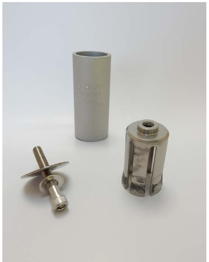
写真3. コレットラグ部品構成