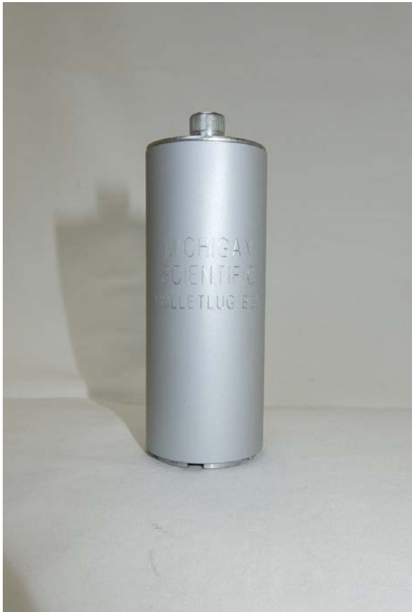
写真2. コレットラグ単品