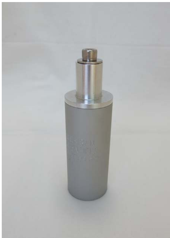
写真4. オプション品:軸長調整カラー (13mm, 25mm, 38mmの3種類)